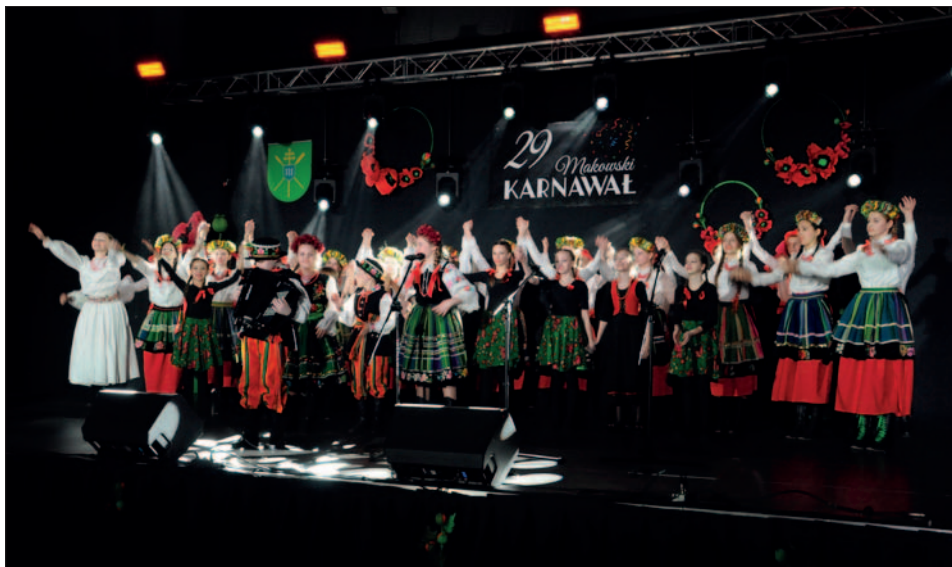
Dalszy ciąg relacji i fotorelacja z XXIX Makowskiego Karnawału wewnątrz numeru.