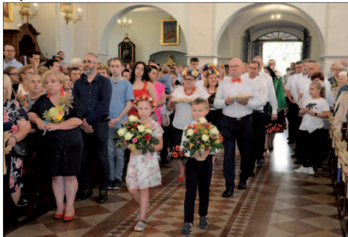
Dożynki w Gminie