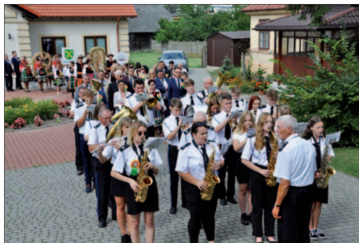
Dożynki w Powiecie