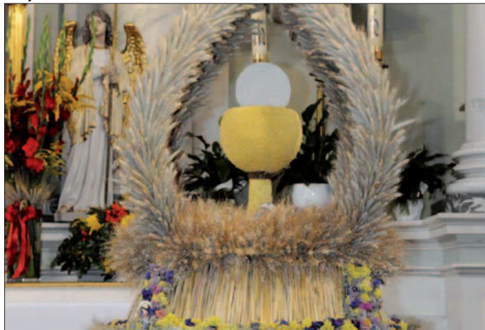
Dożynki w Gminie