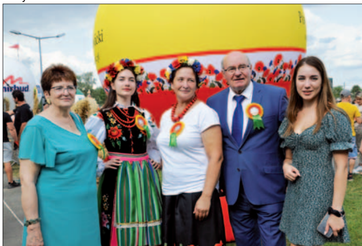
Dożynki w Powiecie