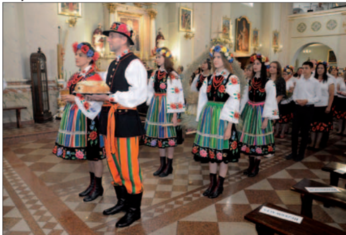
Dożynki w Gminie