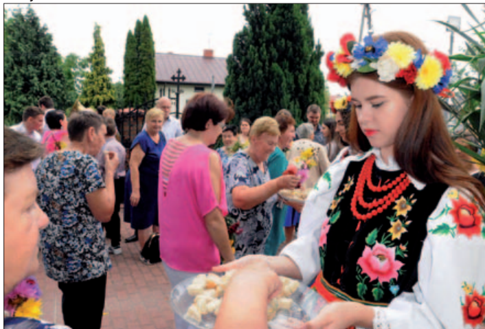
Dożynki w Gminie