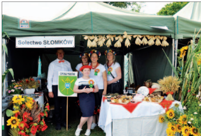
Dożynki w Powiecie