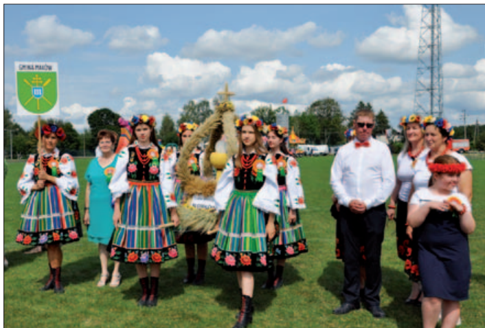
Dożynki w Powiecie