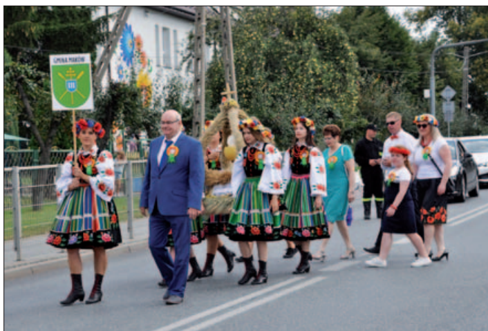
Dożynki w Powiecie

Bardzo serdecznie dziękujemy mieszkańcom Sołectwa Słomków za zaangażowanie i pracę włożoną w przygotowanie tegorocznych dożynek.