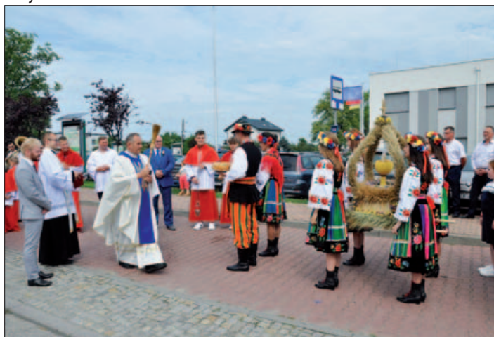
Dożynki w Gminie